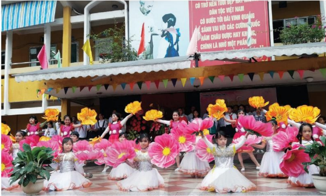
HS biểu diễn văn nghệ chào mừng Ngày Nhà giáo Việt Nam