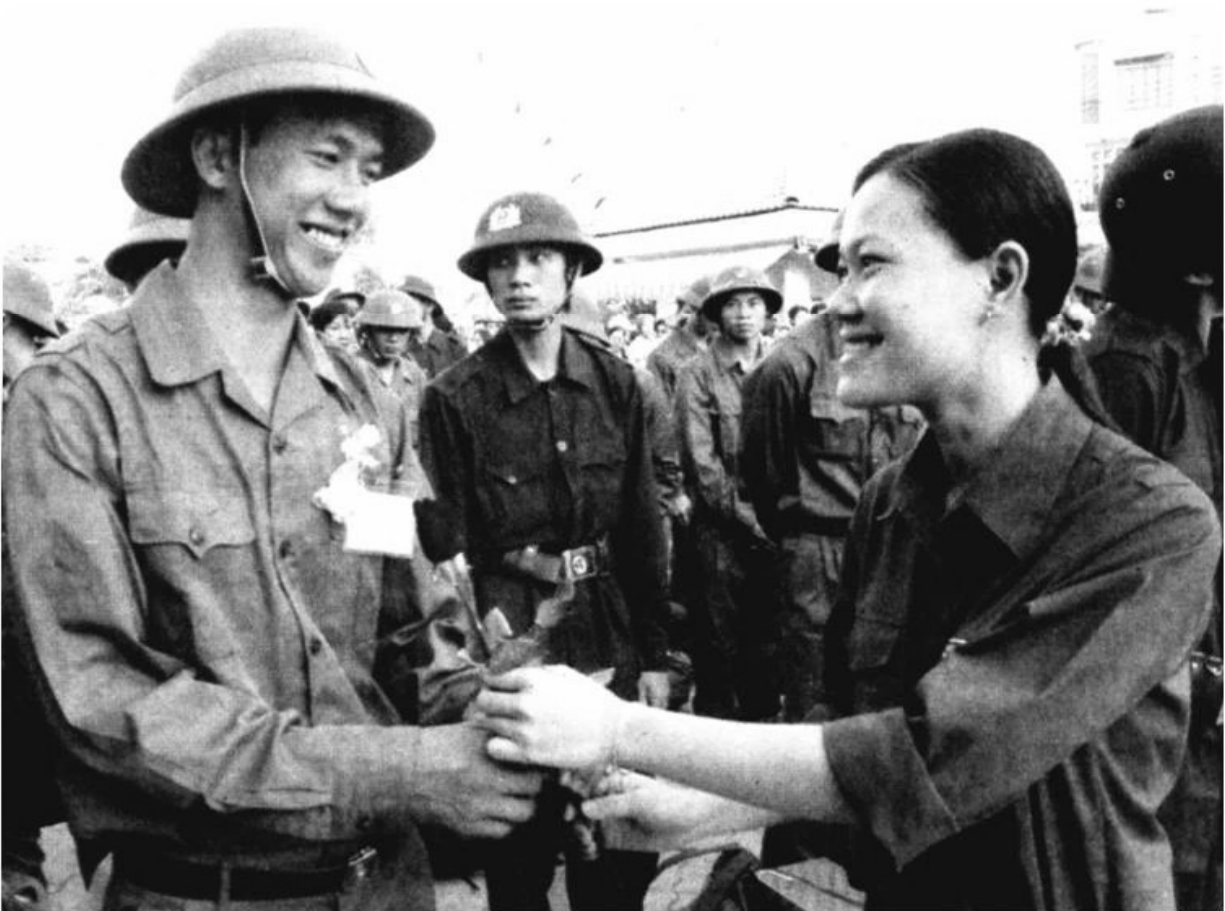
Thanh niên lên đường làm nghĩa vụ bảo vệ Tổ quốc.

Là những công dân trẻ tuổi yêu nước, thanh niên học sinh chúng ta có trách nhiệm :