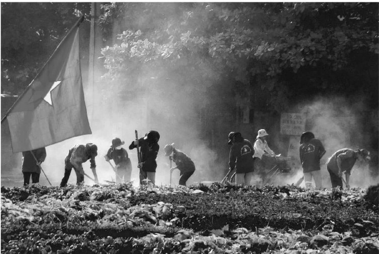
Thanh niên học sinh tham gia hoạt động bảo vệ môi trường.

– Bảo vệ và sử dụng tiết kiệm tài nguyên thiên nhiên : bảo vệ nguồn nước, bảo vệ các giống loài động, thực vật ; không đốt phá rừng, khai thác khoáng sản một cách bừa bãi ; không dùng chất nổ, điện,... để đánh bắt thủy, hải sản ; không tham gia vào các hành vi vận chuyển, mua bán động vật quý hiếm.