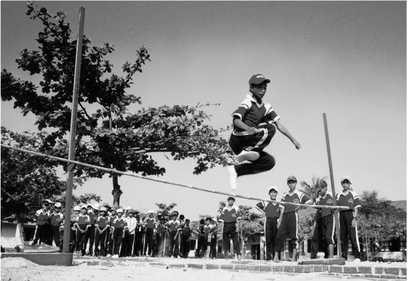
Tích cực rèn luyện thân thể.