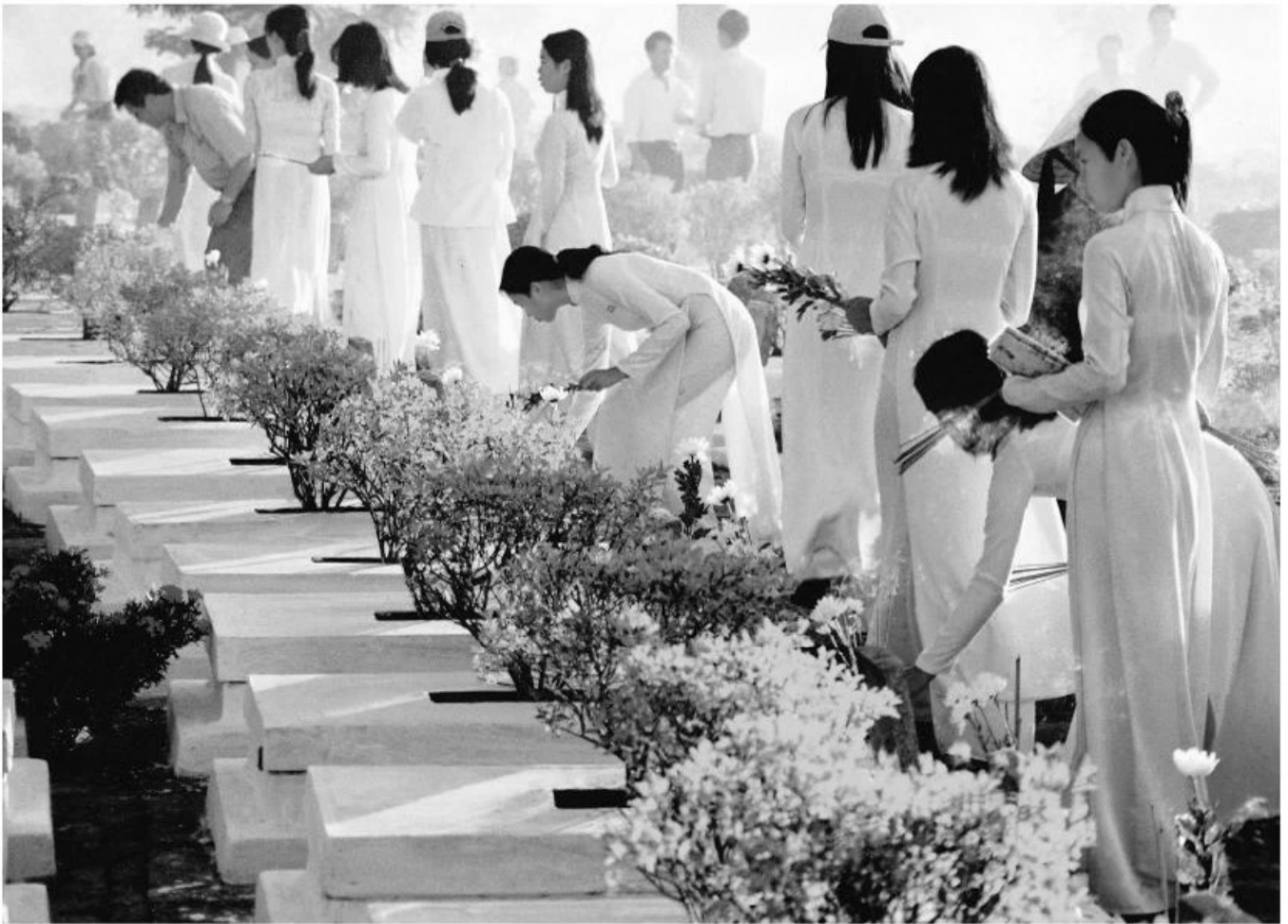
Thanh niên học sinh thăm viếng nghĩa trang liệt sĩ.