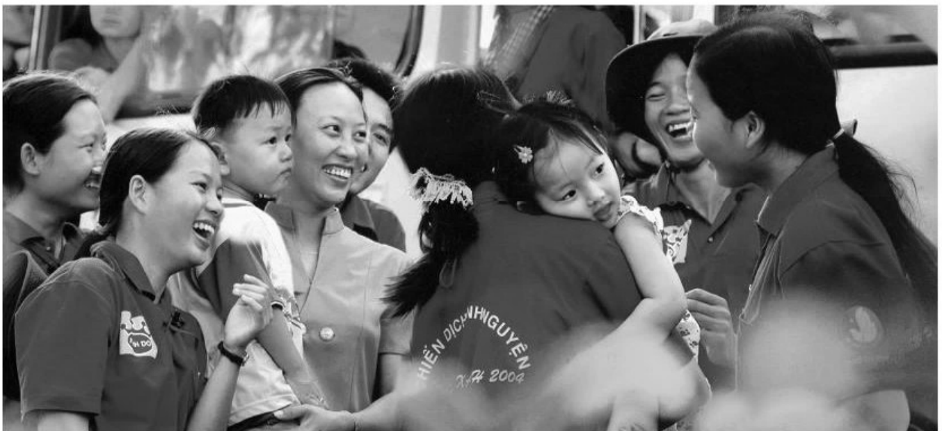
Thanh niên tình nguyện – đi dân nhớ, ở dân thương.

- Tích cực tham gia các hoạt động tập thể, hoạt động xã hội do nhà trường, địa phương tổ chức ; đồng thời vận động bạn bè và mọi người cùng tham gia.